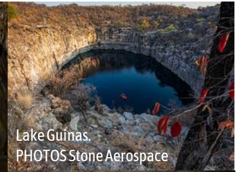
Lake Guinas.