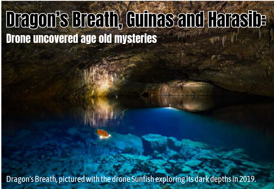
Dragon's Breath, pictured with the drone Sunfish exploring its dark depths in 2019.