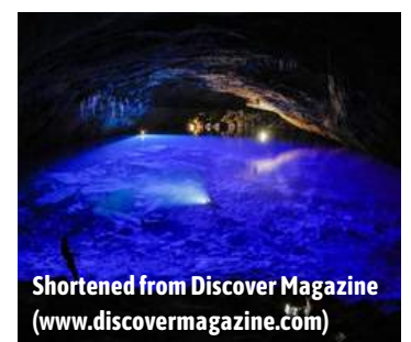
Shortened from Discover Magazine ( www.discovermagazine.com )

The expedition team was hoping to see more than just the austere beauty of Namibia's subterranean caves; they wanted to use the remote locations as a testing ground for a new iteration of autonomous, underwater vehicle.