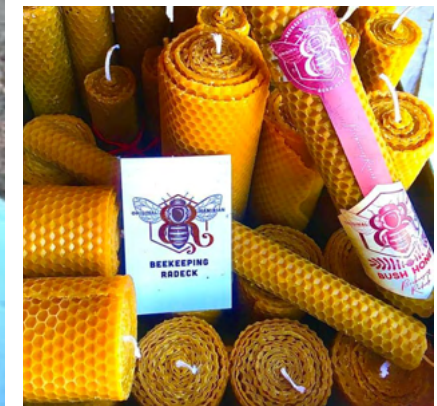
Otjiwarongo se bekende byeboer, Dieter Radeck.