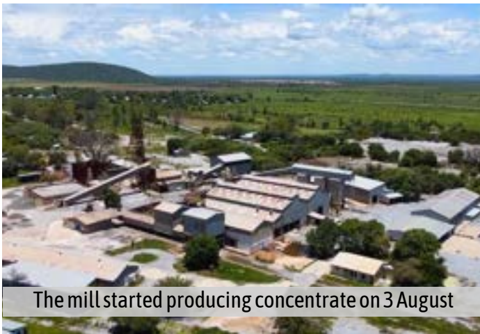
The mill started producing concentrate on 3 August