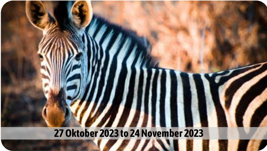
27 Oktober 2023 to 24 November 2023

Want to advertise your event free of charge? Send all details by the 20th of the month to 067triangle@gmail.com .