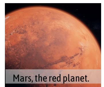
Mars, the red planet.

Meteors will radiate from the Ursa Minor constellation, but can appear anywhere in the sky.